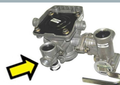
2-Leitungsanlagen inkl. Löseventil automatisch!